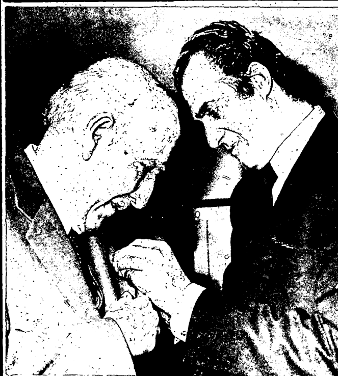
GRAN CRUZ DE LA ORDEN DE CARLOS III A VICENTE ALEIXANDRE

SUPLEMENTO DIARIO DE "EL CASON DE JASTRE"